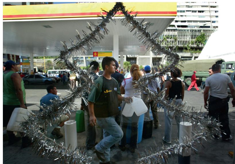
LAS DIFÍCILES IMÁGENES DE LA NAVIDAD EN VENEZUELA.