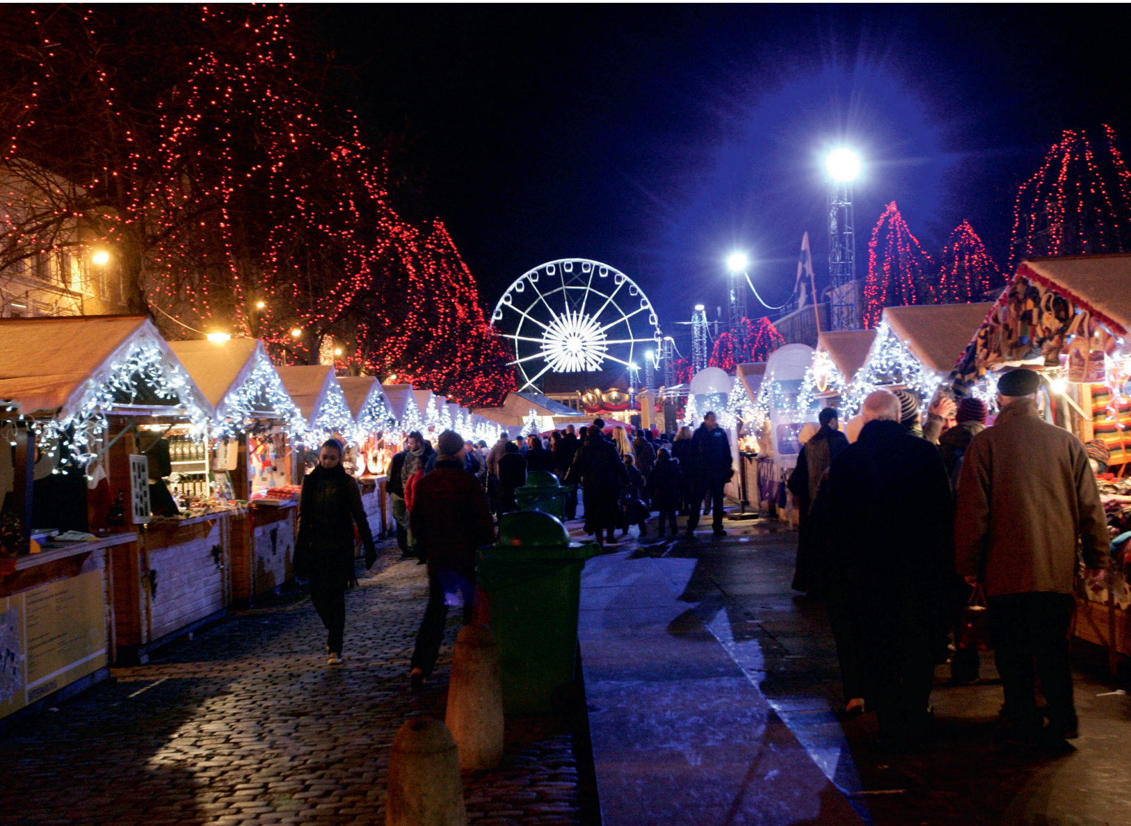
TÍPICOS MERCADOS DE NAVIDAD EN BÉLGICA.